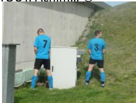
Oli&Michi sind erleichtert....