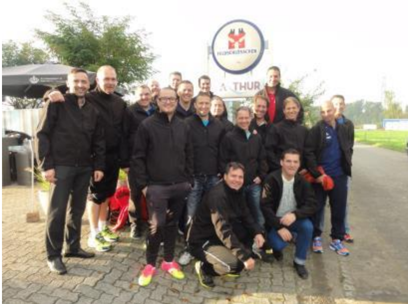
Motivierte und zielorientierte Jungs