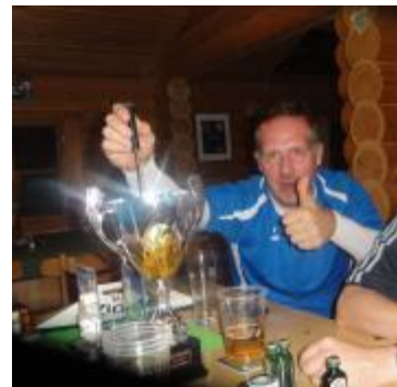
Fondue usem Pokal... LECKER !!