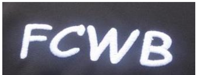
Einheitliche Kleidung; damit man sich auch in den Bergen zu jeder Tag & Nachtzeit wieder findet.....