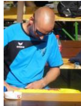
Altersbeschwerden oder Matchvorbereitung???