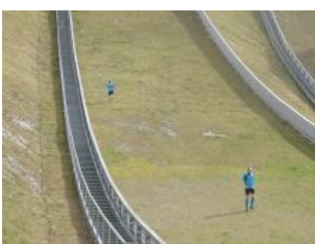
Päsci`s Einlauftrick war erfolgreich!