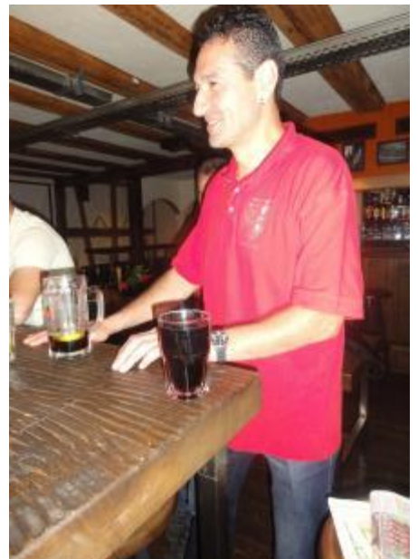
Der Capitano als Vorbild! Nur Koffein und KEIN Alkohol!