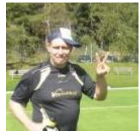
Immer locker bleiben