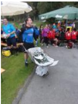
Nicht alles von uns!!