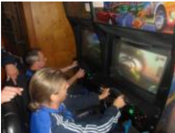
Promille-Race... Obs mit 3D Brille besser geht???