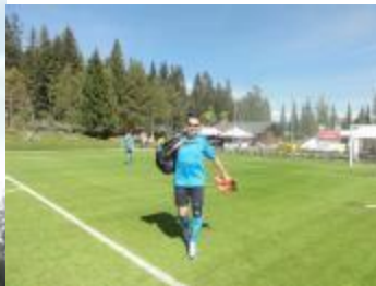
Sonnenbrillen Trick schon am Freitag...