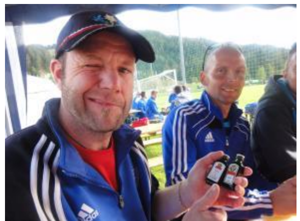
Wenns kai Appüzeller me het, gits halt Jägermeister....