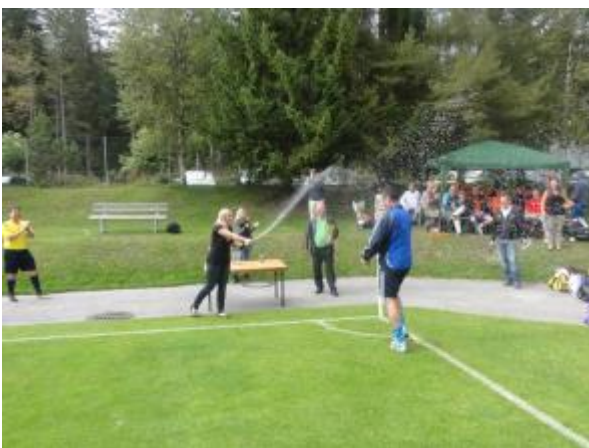
Champagner Dusche für den CAPITANO