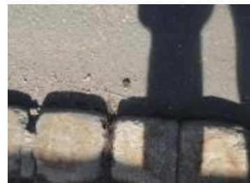
Wer war da auf dem Heimweg???