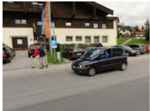
& de Napoli-Fancar natürlich au...