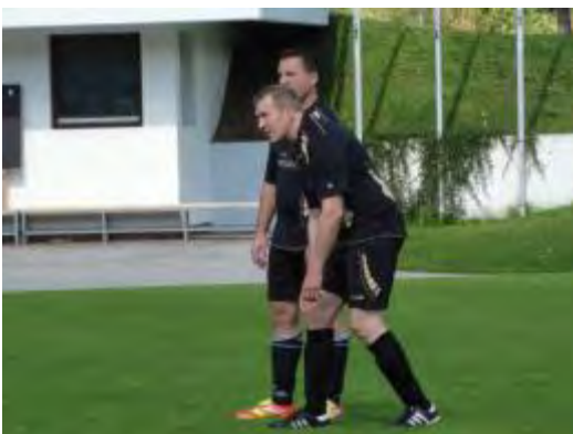
Hey Aadorfer, wenn mir kain Ball spielsch zahlstsch im Fall au is Phraseschwein.....