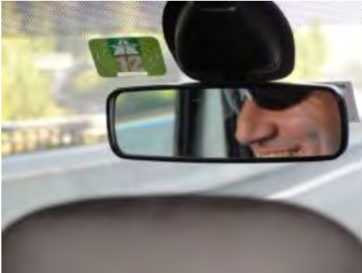
Jojo, ROLF, do lachs no....