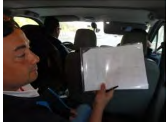
Unser Fux an der Seitenlinie mit der ersten 11! So einfach wars noch nie mit nur 12 Spielern...