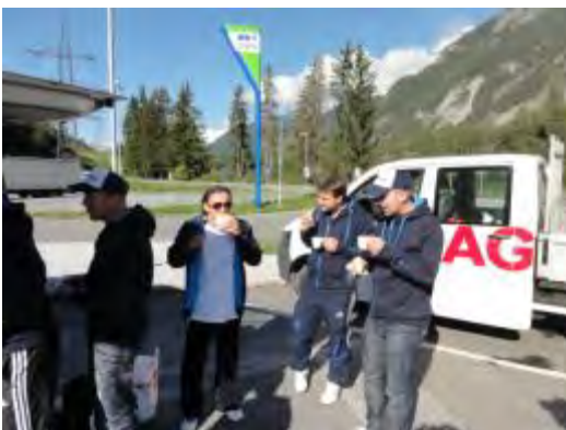
Nach dem Arlberg ist vor SEEFELD... Sandwich mit Kafi Hüüü