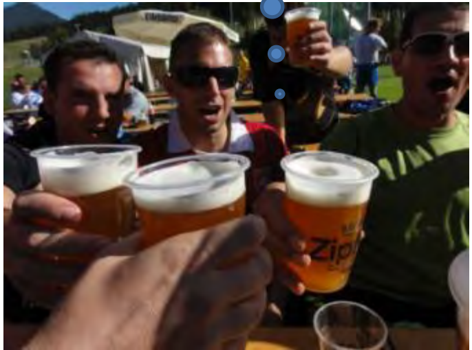
JÄGERMEISTER war letztes Jahr; 2012 lebe der MARILLENSCHNAPS...