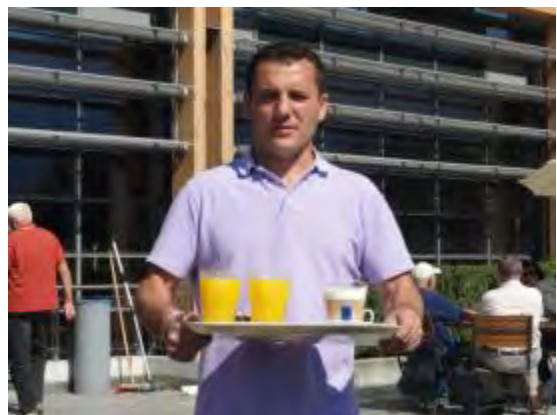
Flotte Cheib..... Bringsch de O-Saft vom Casino für`s Zimmer 323 ?