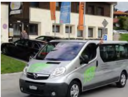
Dä fährt sowieso.....