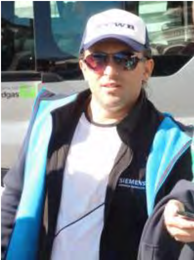
AAABDI....was ziehsch denn du im WINTER a??