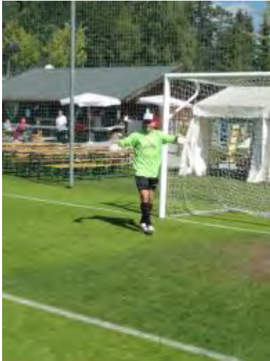
Üsen neue Goalie.... Gsund und seriös het er nu d Hälfti ghebet.... ;-)